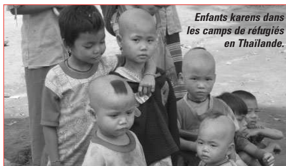
Enfants karens dans les camps de réfugiés en Thaïlande.

AMI s'est positionnée depuis sa création en faveur de ces femmes et ces hommes que les médias ignorent. Afin de pouvoir comprendre les raisons d'un tel positionnement, revenons sur quelques pages d'histoire d' AMI et plus particulièrement sur l'Afghanistan, notre mission phare. Ce pays traversé par huit années de guerre sous le régime soviétique a vu survenir la mort et le déplacement de millions de civils. Après les attentats du 11 septembre, qui se soucie encore aujourd'hui des traces laissées par les talibans ? Dès 1980 pourtant, nos équipes étaient présentes pour pallier la situation sanitaire défectueuse. Notre mission : former du personnel médical dans les provinces les plus inaccessibles (les vallées du Nouristan et de Weygal).