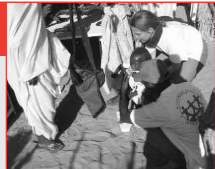
Cliniques mobiles AMI auprès des populations rurales du Darfour.

Outre le fait que nous dénonçons et condamnons cette terrible attaque, nous nous sentons aujourd'hui orphelins... orphelins de cette population que nous avons appris à connaître et avec laquelle nous partageons des moments de joie et d'inquiétude quotidiens liés à la guerre.